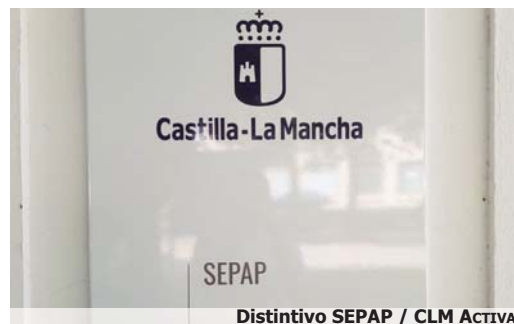
Distintivo SEPAP / CLM Activa