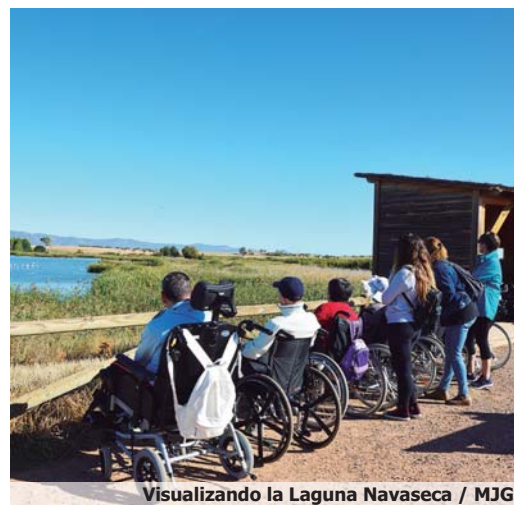
Visualizando la Laguna Navaseca / MJG