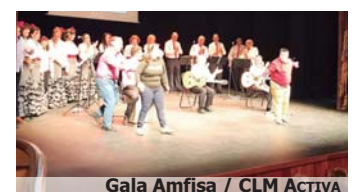
Gala Amfisa / CLM Activa

La recaudación de la gala solidaria de 350 € aproximadamente se dedicará a la compra de materiales para el aula de respiro de las personas con discapacidad.