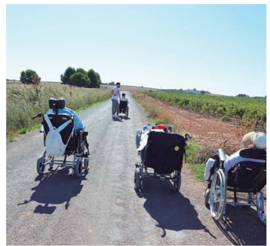
Zona transitable del entorno

Todo eso ya ha pasado a la historia y ahora la depuradora de aguas residuales de Daimiel (Ciudad Real) juega un papel fundamental en la existencia de la laguna, además de encontrarse perfectamente integrada en el entorno. Gracias a ella se ha logrado que una actividad antaño insalubre y molesta, sirva para generar ahora recursos medioambientales, sociales e incluso económicos.