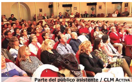
Parte del público asistente