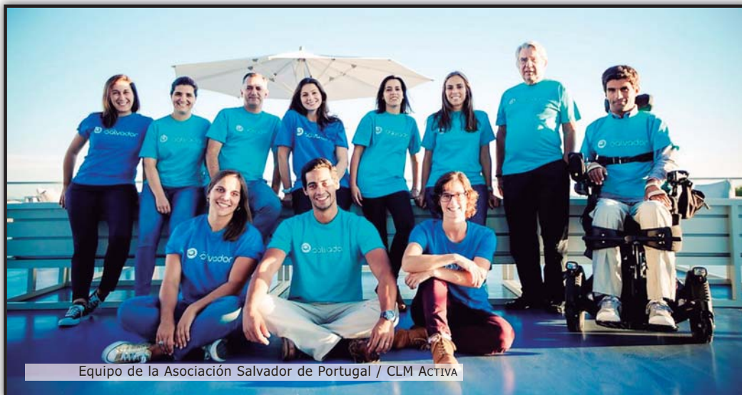
Equipo de la Asociación Salvador de Portugal / CLM ACTIVA

otros, que son algunos de ellos causas potenciales de discapacidad física adquirida.