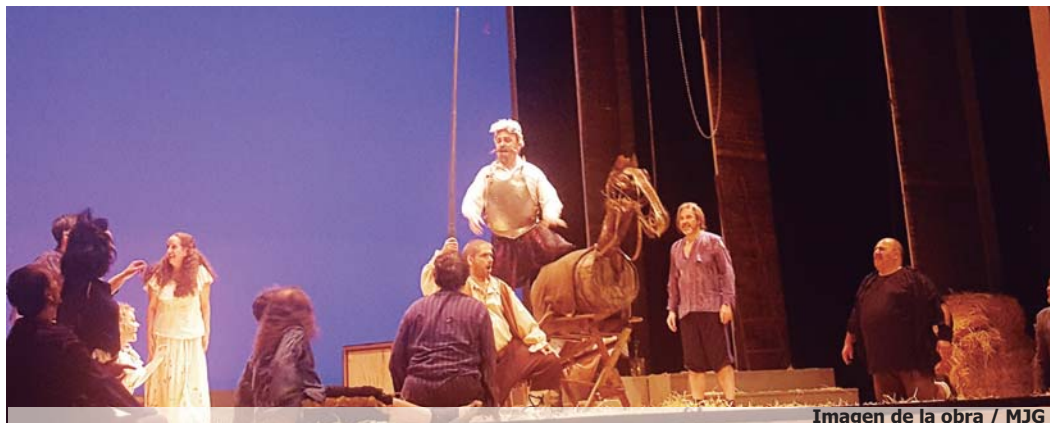
Imagen de la obra

Por su parte, Mitch Leigh es un compositor de teatro musical estadounidense y el productor teatral más conocido por dicho musical. Fue en 1965 cuando se asoció con el letrista Joe Karion y el escritor Dale Wasserman para escribir este musical. El espectáculo resultante, el musical 'El hombre de la Mancha' se estrenó en Broadway ese mismo año y logró 2328 actuaciones.