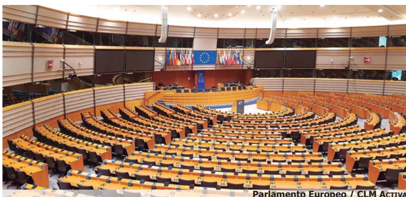
Parlamento Europeo / CLM ACTIVA

Maestre reconoció la labor que viene realizando ORETANIA