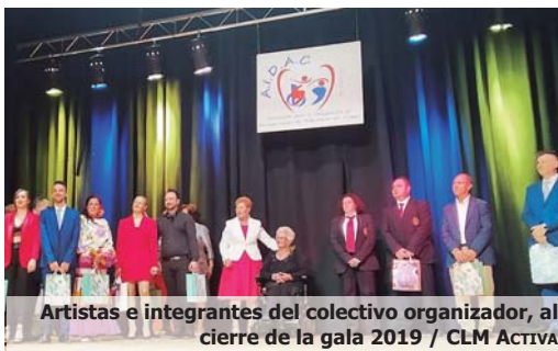
Artistas e integrantes del colectivo organizador, al cierre de la gala 2019