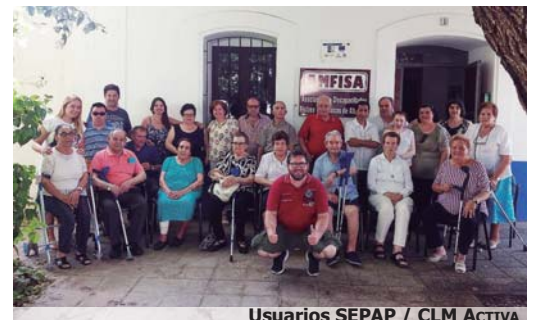
Usuarios SEPAP / CLM Activa

cabo sesiones de fisioterapia individual cuando la persona por sus circunstancias y capacidades físicas y funcionales así lo requiere.