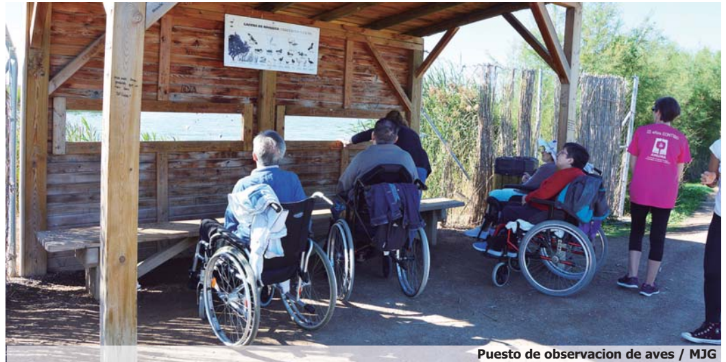
Puesto de observación de aves

Sin embargo, esto no siempre ha sido así. Antiguamente, la presencia de la laguna dependía de variaciones intermitentes del nivel del acuífero e incluso los bien intencionados intentos de utilizar sistemas verdes de depuración, resultaron más dañinos que beneficiosos para la existencia de esta laguna.