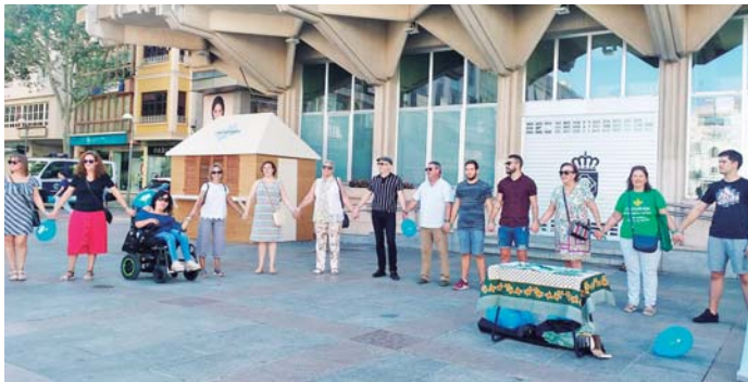
Cadena Humana ACREAR

Conferencias, mesas informativas y hasta una cadena humana para visibilizar la dolencia