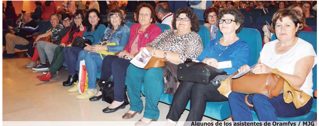
Algunos de los asistentes de Oramfys

'El Hombre de la Mancha' para la que Wasserman escribió el libreto, se estrenó Off Broadway en 1965 y pasó a Broadway a continuación. En 1967 obtuvo el Tony al mejor musical y se convirtió en uno de los musicales favoritos de todos los tiempos. La letra de su himno emblemático, 'El sueño imposible' sale directamente de la fuente literaria de la obra, que no es, como suele suponerse, el Don Quijote de Cervantes, sino algo escrito por el propio Wasserman a finales de los cincuenta.