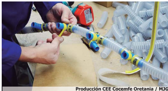
Producción CEE Cocemfe Oretania / MJG

Otras de las demandas del CERMI en materia de trabajo son, entre otras, prohibir que las empresas y entidades que incumplen la cuota de reserva de puestos de trabajo para personas con discapacidad puedan recibir subvenciones por parte de las administraciones; que las personas con capacidad intelectual límite que no alcancen el 33% de discapacidad reconocida oficialmente puedan acceder al marco de incentivos establecido para favorecer su inclusión laboral; aprobar una ley de impulso del emprendimiento para personas con discapacidad, y obligar por ley a que las herramientas digitales de las empresas sean accesibles, poniendo a su disposición ayudas e incentivos cuando haya que hacer adaptaciones.