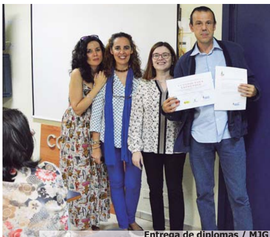
Entrega de diplomas / MJG

En un ambiente discernido y con un alto grado de compañerismo, el pasado mes se clausuraba el curso de 'Operaciones auxiliares de servicios administrativos y generales'. Con un total de 400 horas lectivas y 80 horas de prácticas con empresas, este curso ha pretendido a los alumnos que lo han realizado aprender a distribuir, producir y transmitir la información y la documentación requeridas en las tareas administrativas y de gestión, tanto internas como externas, así como realizar trámites elementales de verificación de datos y documentos a requerimiento de técnicos de nivel superior con eficacia, de acuerdo con las ins-