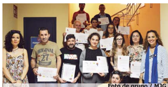
Foto de grupo