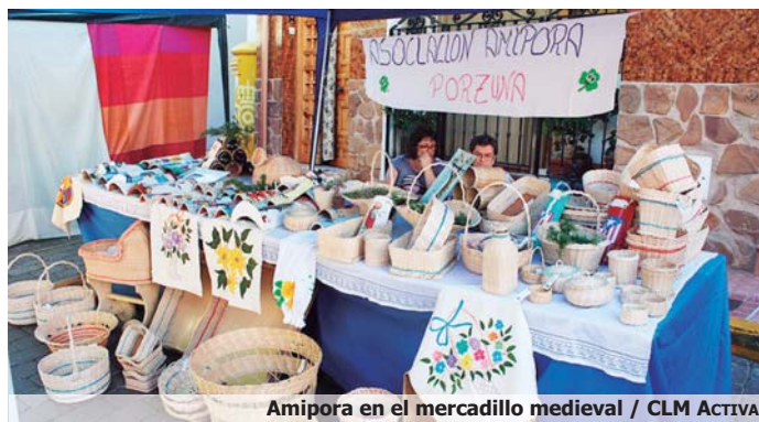
Amipora en el mercadillo medieval