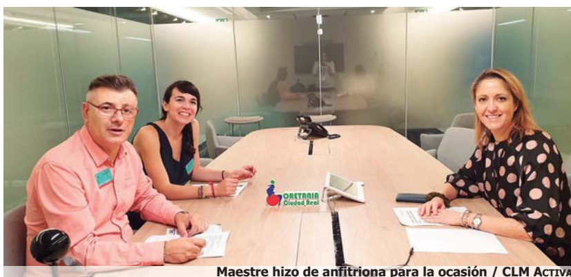
Maestre hizo de anfitriona para la ocasión

Ciudad Real en los últimos años como referente del colectivo de personas con discapacidad en la provincia y se comprometió a seguir apoyando este trabajo desde Europa ya que como manifestara en redes sociales "sus proyectos europeos,