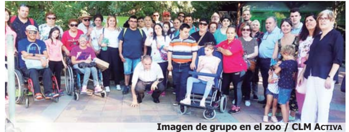
Imagen de grupo en el zoo

El grupo también pudo contemplar varias exhibiciones, "aves rapaces, loros y guacamayos y por la tarde focas marinas y delfines", concluyen.